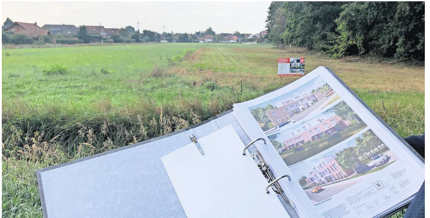
Im rechten vorderen Bereich des Baugebiets will der Uetzer Sascha Fiene drei Häuser bauen.

„Ich scharre mit den Hufen, weil meine Pläne jetzt stehen“, sagt Fiene,