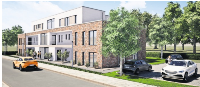
So soll das Mehrfamilienhaus mit zehn Wohnungen an der Hünenburgstraße aussehen.

ne, der noch einige Ergänzungen aufnimmt – darunter einen Spielplatz. „Meine Zielgruppe sind eigentlich ältere Bewohner, aber auch die haben ja Enkel“, sagt er. Er geht davon aus, dass er den Bauantrag im November stellen werde. Für Januar oder Februar 2021 rechnet er mit der Baugenehmigung, sodass die Arbeiten für die Neubauten im April beginnen könnten. Etwa ein Jahr später sollen dann die ersten Bewohner einziehen, hofft der Unternehmer.